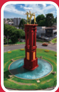
Fonte de Jerusalém